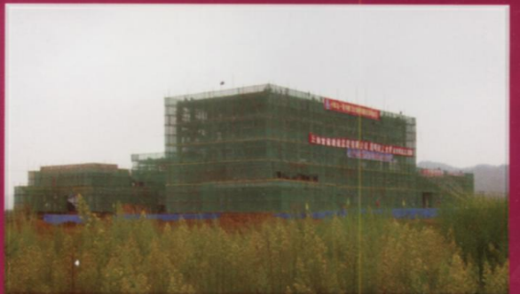
正在建设中的后勤一号楼