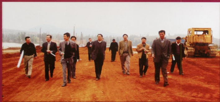
我校校领导到呈贡新校区视察并指导工作