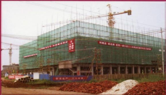
正在建设中的公共教学楼