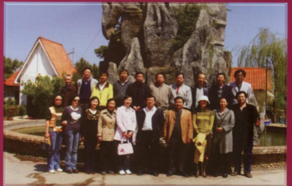
呈贡校区建设指挥部全体工作人员合影