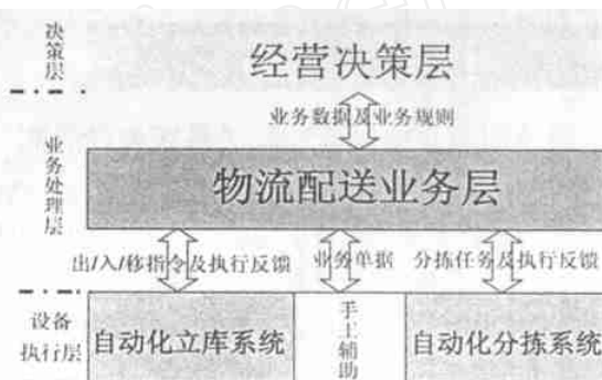
图1 卷烟供应链系统层次结构

同时四部分之间又存在着非常紧密的联系,订单数据是制定配送计划的主要依据,采购计划制定主要依据库存和销量统计.电子商务功能紧密地融合在订单接收、采购管理、供应商及客户关系管理、会计结